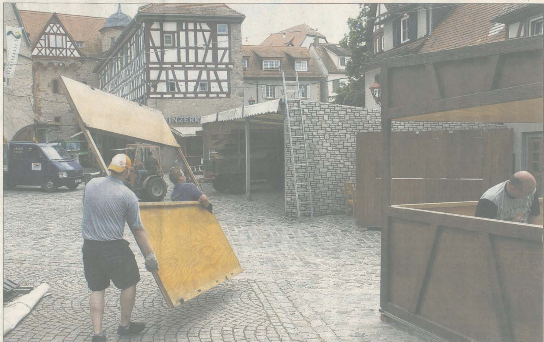
Alle Hände voll zu tun: Bevor am heutigen Freitag (25.) der Startschuss für den Bergsträßer Weinmarkt fällt, muss erst einmal die Kulisse für das größte Fest in Heppenheim geschaffen werden. Mitarbeiter der Stadt und der gastronomischen Betriebe haben schon vor Tagen begonnen, Großzelt, Bühnen und Weinbuchten aufzubauen.